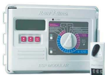
Sterownik ESP MODULAR 10 sekcji