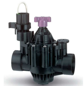
12 zaworów 1.5" PGA