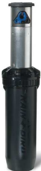
24 zraszacze Falcon 6504 - SS