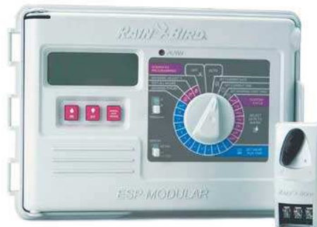
Sterownik ESP Modular 12 sekcji